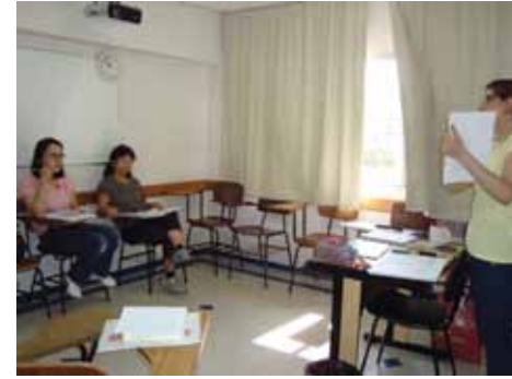
Curso de Português oferece dicas para entender melhor o Brasil